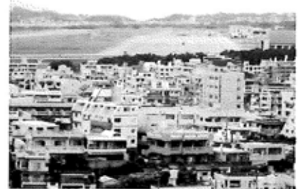
普天間基地滑走路 (写真上方)