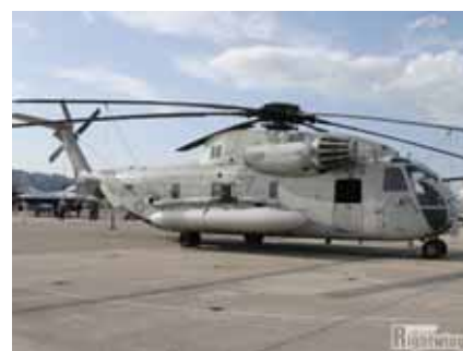
CH53D (胴体全長 20.47m)

*彼は小学校6年生のときに、米軍ヘリ墜落事故に抗議する宜野湾市民大会 (2004.9.12)で、小学生代表として基地のない沖縄を訴えたことがある。